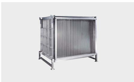
Récupérateurs de chaleur très haute température