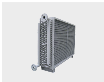
Batterie de récupération